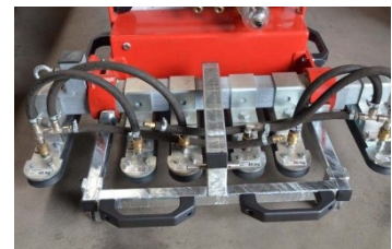
4.) Verriegelungsbügel über die Haupttraverse anbringen und durch Steckbolzen...