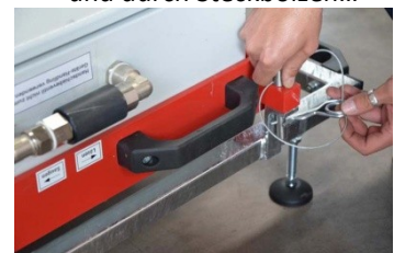
6.) Auf jeder Seite den CLAD-BOY mit Steckbolzen und Sicherungen am CARRY-BOY fixieren