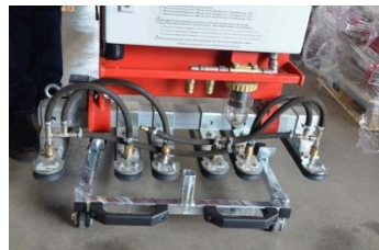
1.) CLAD-BOY mit den Lagerschalen aufsetzen

Verriegelungsbügel durch Steckbolzen mit Sicherung, sowie die zwei Steckbolzen mit Sicherungen entfernen