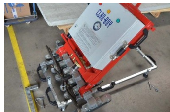
3.) CLAD-BOY langsam bis in die Horizontale absenken.