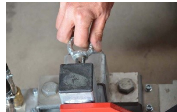
2.) Schwenkarretierung lösen